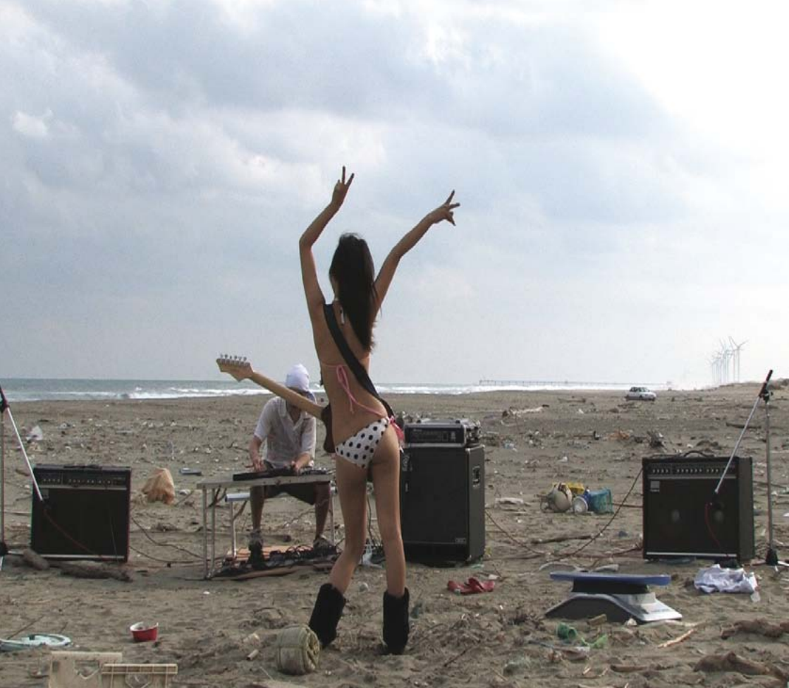
photo extraite de We don't care about music anyway... de Cédric Dupire et Gaspard Kuentz