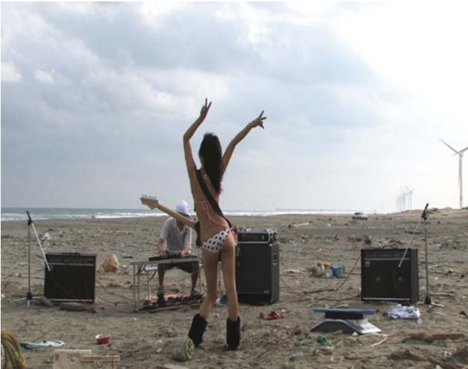
We Don't Care About Music Anyway... de Cédric Dupire et Gaspard Kuentz