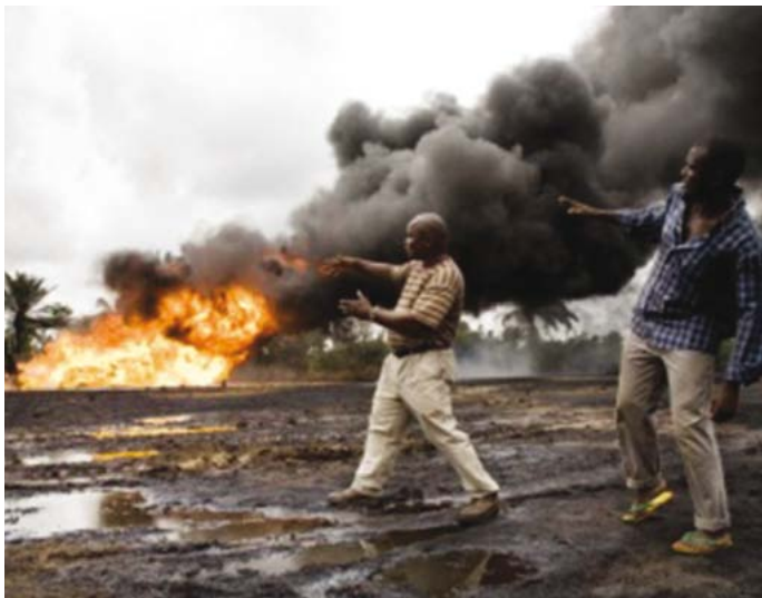
Delta, Oil's Dirty Business de Yorgos Avgeropoulos