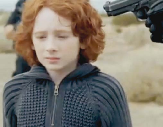
MIA - Born Free - réalisation : Romain Gavras