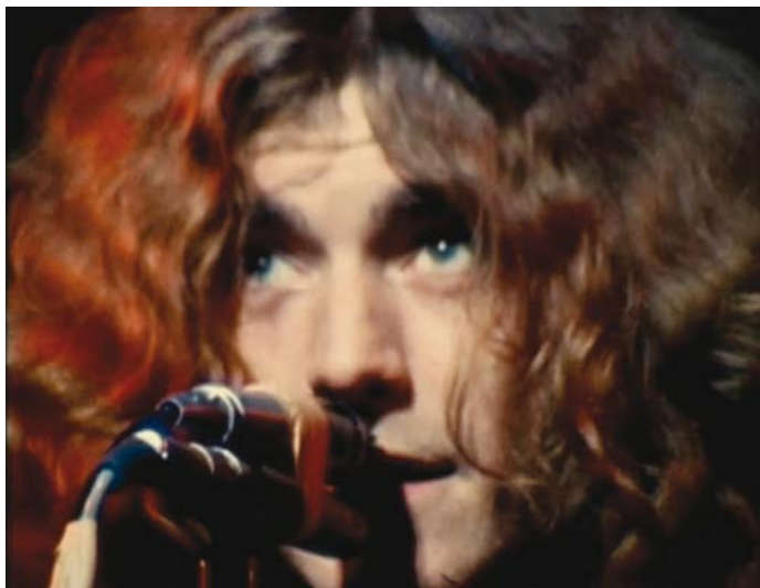
Led Zeppelin live at the Royal Albert Hall de Peter Whitehead